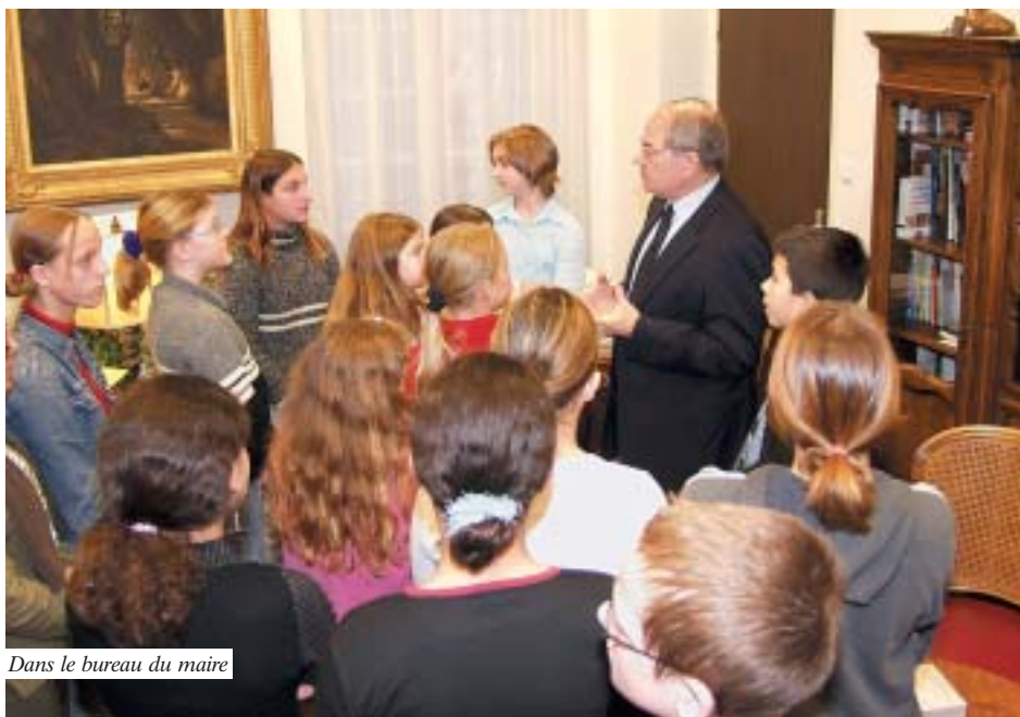
Dans le bureau du maire

CE SAMEDI 4 DÉCEMBRE, LA MAIRIE AVAIT PRIS UN SÉRIEUX COUP DE JEUNE ! LA SALLE DU CONSEIL MUNICIPAL RÉSONNAIT DE PETITS MURMURES ET GLOUSSEMENTS ET DE NOMBREUX PARENTS, FIERS D'ACCOMPAGNER LEURS PETITS CONSEILLERS EN HERBE, ÉTAIENT VENUS ASSISTER À L'INSTALLATION OFFICIELLE DU NOUVEAU CONSEIL MUNICIPAL JUNIOR DE BOURG.