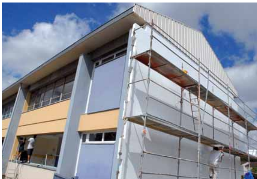
Les élèves des Arbelles ont fait leur rentrée dans une école entièrement rénovée.

Le compte-rendu du Conseil municipal est consultable sur internet, www.bourgenbresse.fr et affiché devant la mairie.