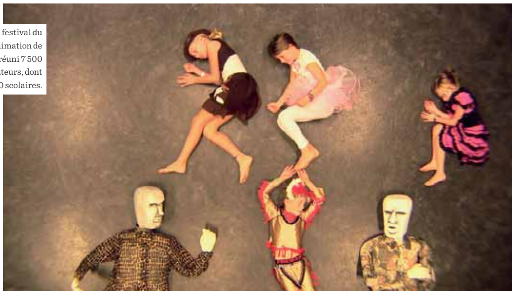
FESTIVAL DU FILM D'ANIMATION

En 2015, le festival du film d'animation de Bourg a réuni 7 500 spectateurs, dont 2 500 scolaires.