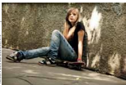
MAISON DES ADOLESCENTS