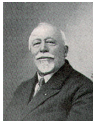
Portrait de Tony Ferret en 1910

À l'occasion du centenaire de la mort de Tony Ferret, architecte phare, le CAUE de l'Ain lui consacre une exposition. À travers une sélection d'archives originales (plans, dessins, photos de famille...), redécouvrez les bâtiments emblématiques qu'il a conçus et réalisés à la Belle Époque, à Bourg, dans l'Ain, dans la Saône-et-Loire et dans le Jura. Levez aussi le voile sur sa vie, ses voyages, ses chantiers, les artistes qui l'ont influencé et les entreprises avec lesquelles il a travaillé. Pendant la durée de l'exposition, l'office de tourisme de Bourg-en-Bresse vous propose, les mercredis et samedis, d'arpenter la ville au gré des constructions et des restaurations laissées par l'architecte.