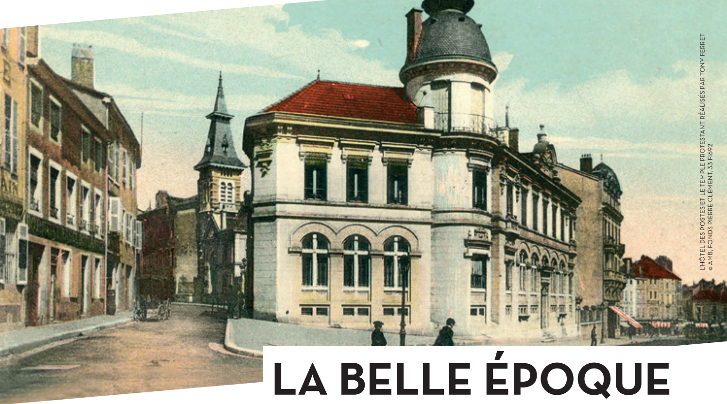
L'HÔTEL DES POSTES ET LE TEMPLE PROTESTANT RÉALISÉS PAR TONY FERRET