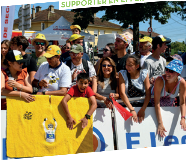
SUPPORTER EN EFFERVESCENCE