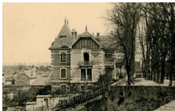
La promenade du Bastion et la Villa Tony Ferret en 1905