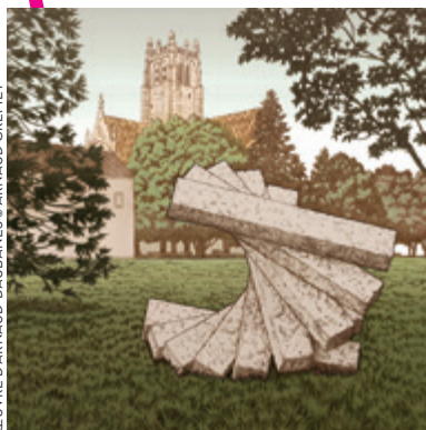
ŒUVRE D'ARNAUD-DALUBANES © ARNAUD CREMET