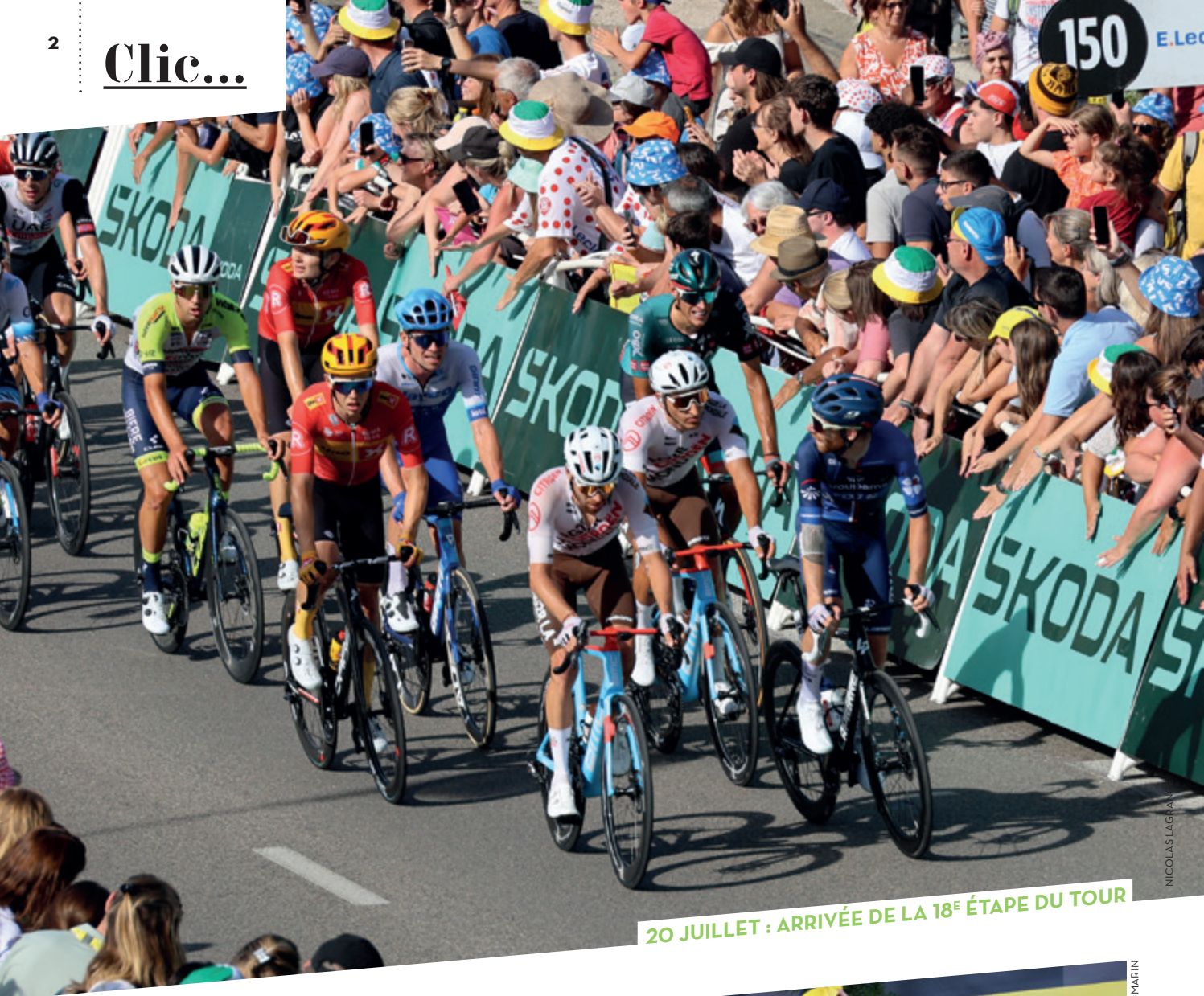
20 JUILLET : ARRIVÉE DE LA 18 E ÉTAPE DU TOUR