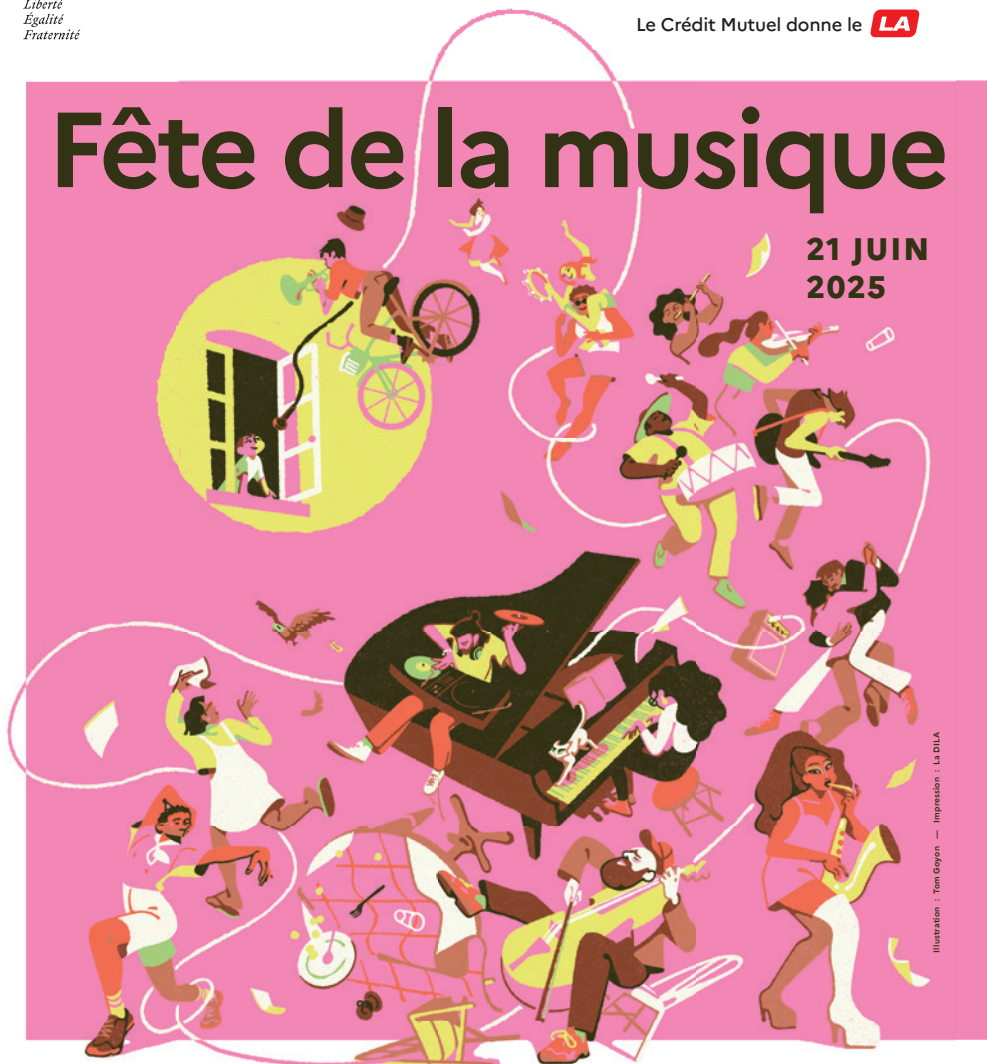
Illustration : Tom Goyon — Impression : La DILA