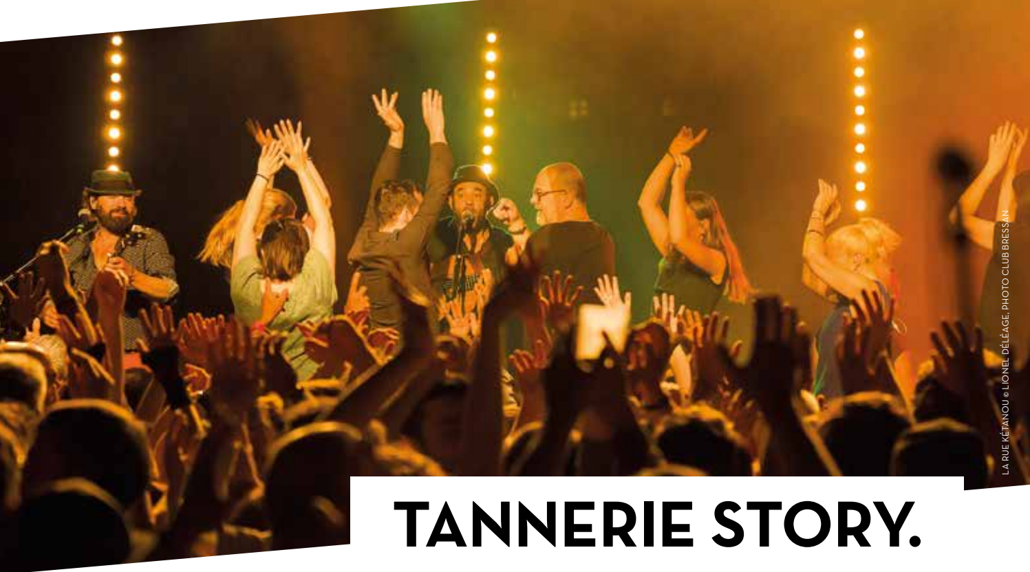
LA RUE KÉTANOU