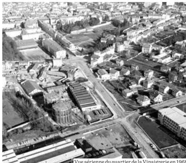
Vue aérienne du quartier de la Vinaigrerie en 1968