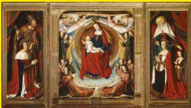
JEAN HEY, TRIPTYQUE DE LA VIERGE GLORIEUSE, DIT TRIPTYQUE DE MOULINS

Chef-d'œuvre de la Renaissance française fraîchement restauré, le Triptyque de Moulins actuellement exposé au Louvre rejoindra Bourg-en-Bresse cet automne pour une exposition exceptionnelle au monastère royal de Brou. Achievé en 1502 par Jean Hey, ce retable monumental sera visible du 12 septembre 2026 au 3 janvier 2027.