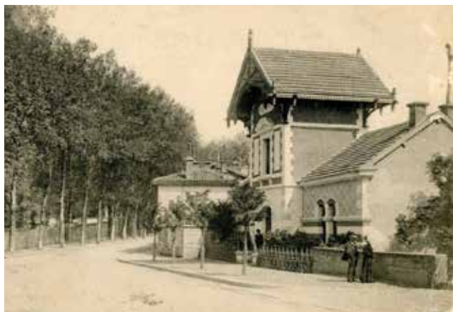
LES BAINS DE BEL-AIR EN 1906

Avec l'arrivée de l'éclairage public, Bourg se dote en 1843 d'une usine à gaz, au-delà de l'enceinte de la ville, dans le secteur de La Vinaigrerie. Un premier gazomètre de 1200 m 3 alimente les rues où un nombre suffisant de commerçants et d'habitants ont souscrit un abonnement. L'usine, qui distille la houille, s'agrandit rapidement avec deux réservoirs géants de 3 000 et 5 000 m 3 . Elle fonctionne jusqu'en 1961, remplacée par le gaz naturel de Lacq. Les gazomètres sont rasés dans les années 1970. Depuis 1999, un skatepark occupe l'ancien site gazier.