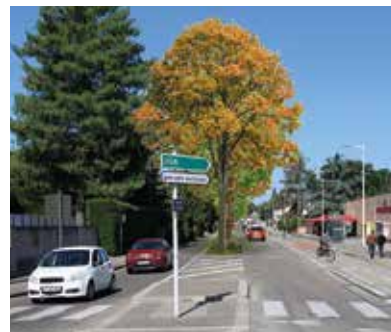
ESQUISSE: SERVICE ESPACES VERTS

Fin des travaux pour le boulevard Paul-Valéry. Après les travaux de gros œuvre qui ont permis la création d'un îlot central pour séparer les voies de circulation, la Ville a planté 14 arbres et de nombreux végétaux. Objectifs à terme : favoriser la biodiversité et, surtout, apporter de l'ombre et de la fraîcheur en été sur cet axe très fréquenté.