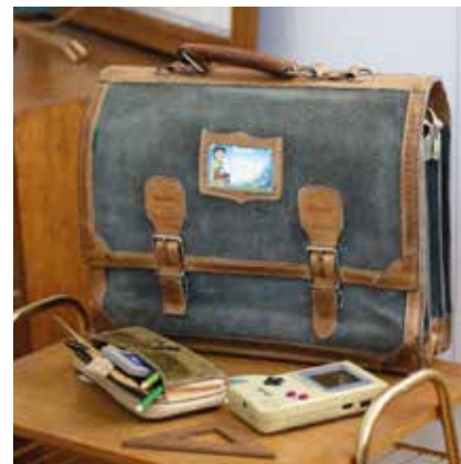
CARTABLE TANN'S

découpent, piquent et assemblent le cuir pour confectionner des pièces de maroquinerie. Pendant la Première Guerre mondiale, elle fournit l'armée française en besaces, bottes... ce qui favorise son essor. Durant 54 ans, l'usine marque la mémoire ouvrière locale. En mai 1968, les employés occupent les ateliers. Dans les années 1970, jusqu'à 400 ouvrières y travaillent. En 1974, la société atteint son apogée avec plus de 1 000 salariés et devient numéro un de la