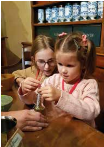
FIFRELIN APOTHIKAIRE e KIDIKLIK

Sur réservation à l'Office de tourisme au 04 74 22 49 40 ou sur bourgenbressedestinations.fr