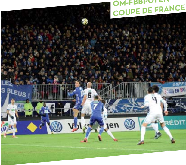
OM-FBBPO1 EN COUPE DE FRANCE