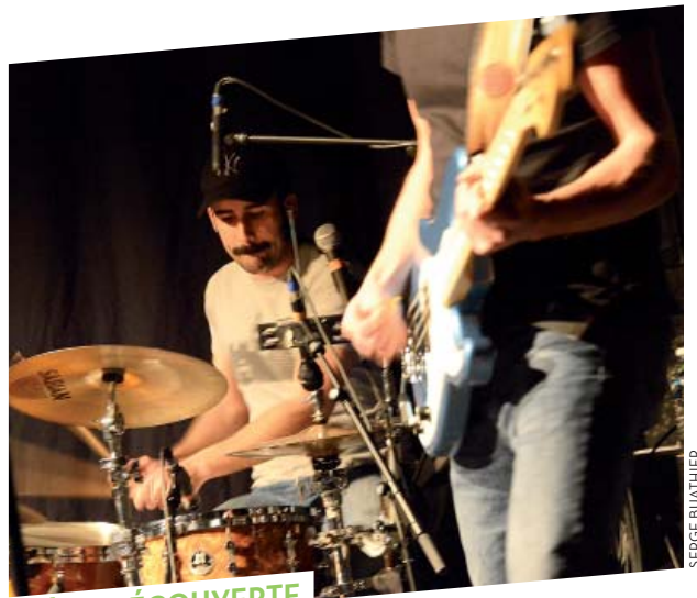
SCÈNE DÉCOUVERTE À LA TANNERIE