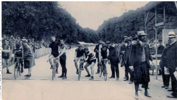
COURSE DU 27 MAI 1906, ORGANISÉE PAR LE VÉLO-CLUB DE BOURG