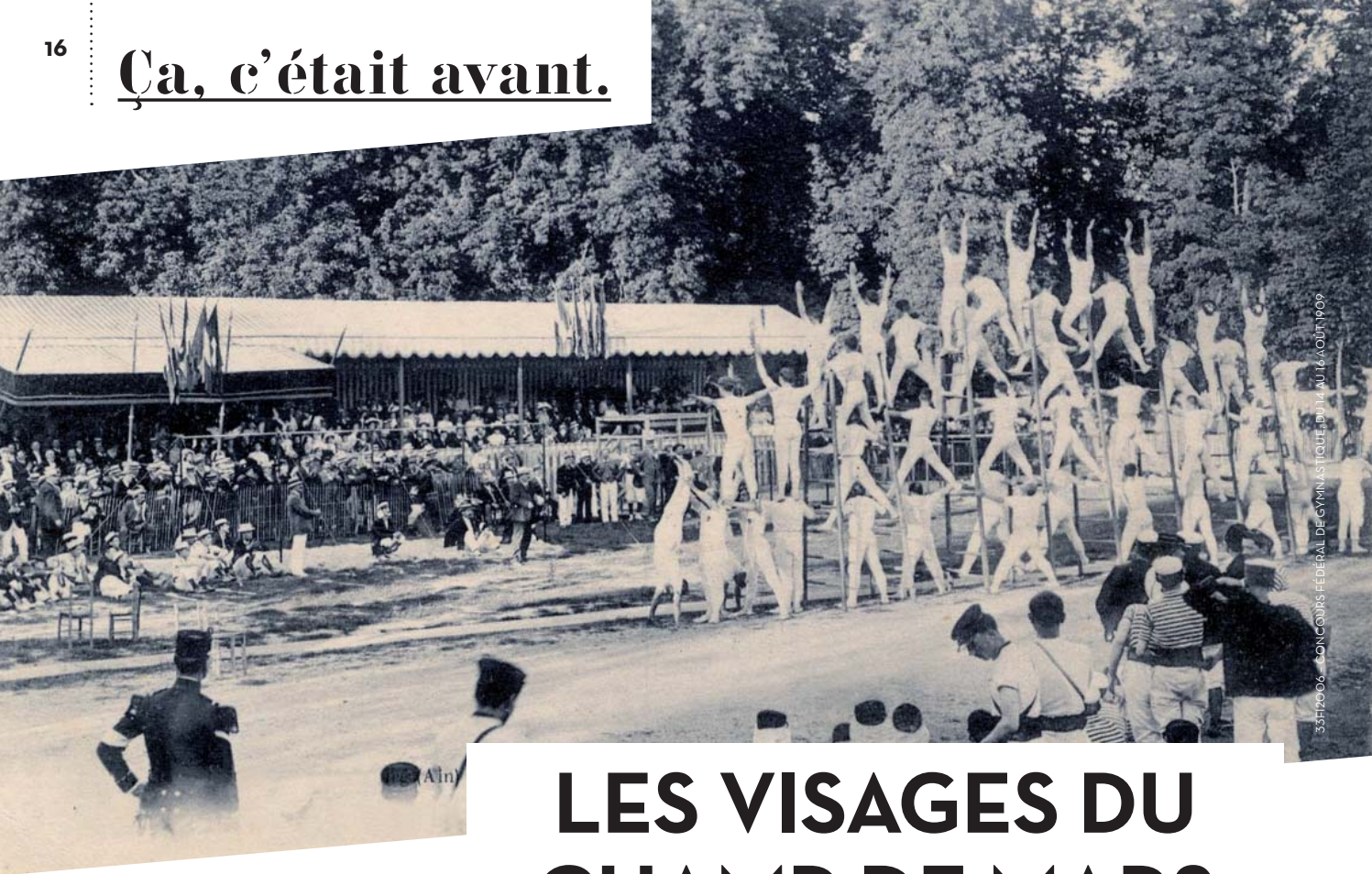
33F12006 - CONCOURS FÉDÉRAL DE GYMNASTIQUE DU 14 AU 16 JUILLET 1909