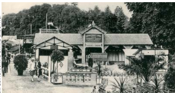
ARCHIVES MUNICIPALES 33FR1948 - FOIRE EXPOSITION - STAND GIRARD GADET 1927

Dimanche 19 juin 1927, un long cortège inaugural traverse la première Foire-exposition de Bourg, organisée par le Comité des fêtes. À proximité du monument aux morts, deux majestueux portiques marquent l'entrée de la foire qui occupe 8 000 m 2 aux Quinconces et sur le Champ de Mars. Avec ses 150 exposants, elle attire entre 50 000 et 80 000 visiteurs et se termine en apothéose par un banquet et un bal. Reconduite jusqu'en 1939, elle sera suspendue de 1940 à 1952 et renaîtra en 1953 au Champ de Foire. Installée depuis 1978 au parc des expositions, la foire s'arrête cette année victime de la désaffection du public.