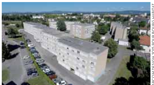
ARCOM DESIGN 2015 POUR BOURG HABITAT