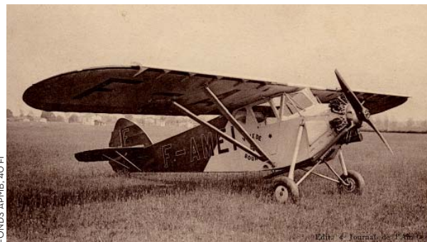
L'AVION VILLE DE BOURG