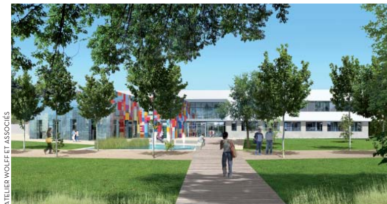
ATELIER WOLFF ET ASSOCIÉS

En mai, le chantier de la maison de la culture et de la citoyenneté va débuter. Au bord de la Reyssouze, le long de l'allée de Challes, un bâtiment aux lignes contemporaines de 3 000 m 2 sortira de terre d'ici l'été 2019. Il accueillera l'AGLCA (maison de la vie associative), la maison des jeunes et de la culture, des associations hébergées en bureaux partagés et un espace coworking . Ce nouvel équipement, qui bénéficiera de deux entrées, l'une côté allée de Challes, l'autre côté Champ de Foire, va redessiner ce secteur du Champ de Foire. Coût des travaux : 5,9 M€ H.T.